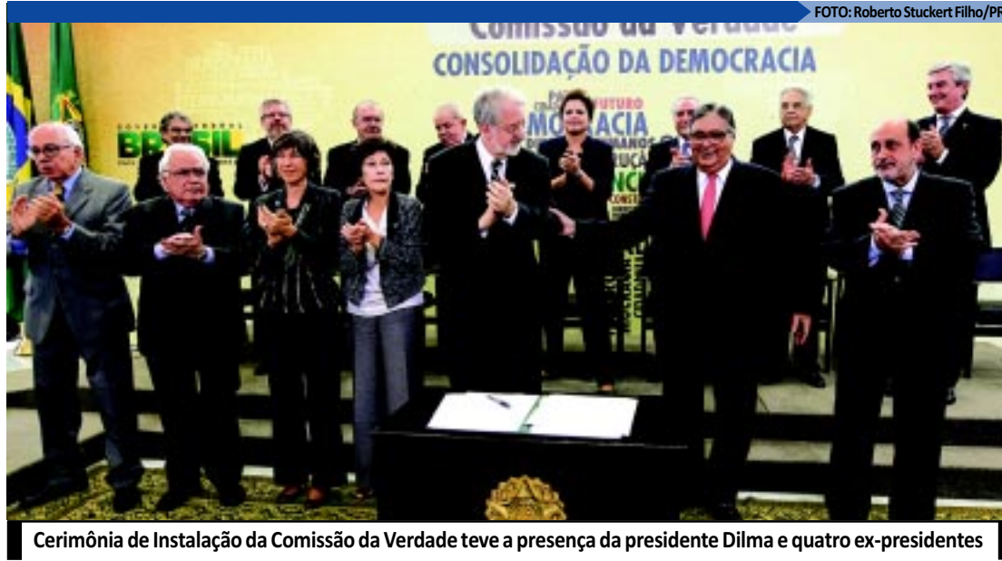
Cerimônia de Instalação da Comissão da Verdade teve a presença da presidente Dilma e quatro ex-presidentes

Ficará mais difícil alguém ousar tratar o conceito de transparência como sinônimo de falta de inteligência, inépcia ou tolice com aquela falta de cerimônia de anos atrás, quando a argumentação foi suficiente para um partido aceitá-la e rejeitar a exibição de suas contas no curso do processo eleitoral.