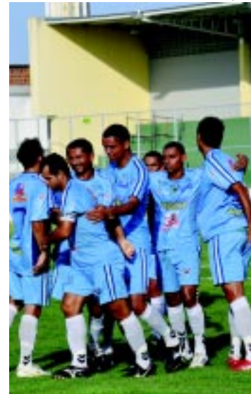
CSP foi destaque no Estadual