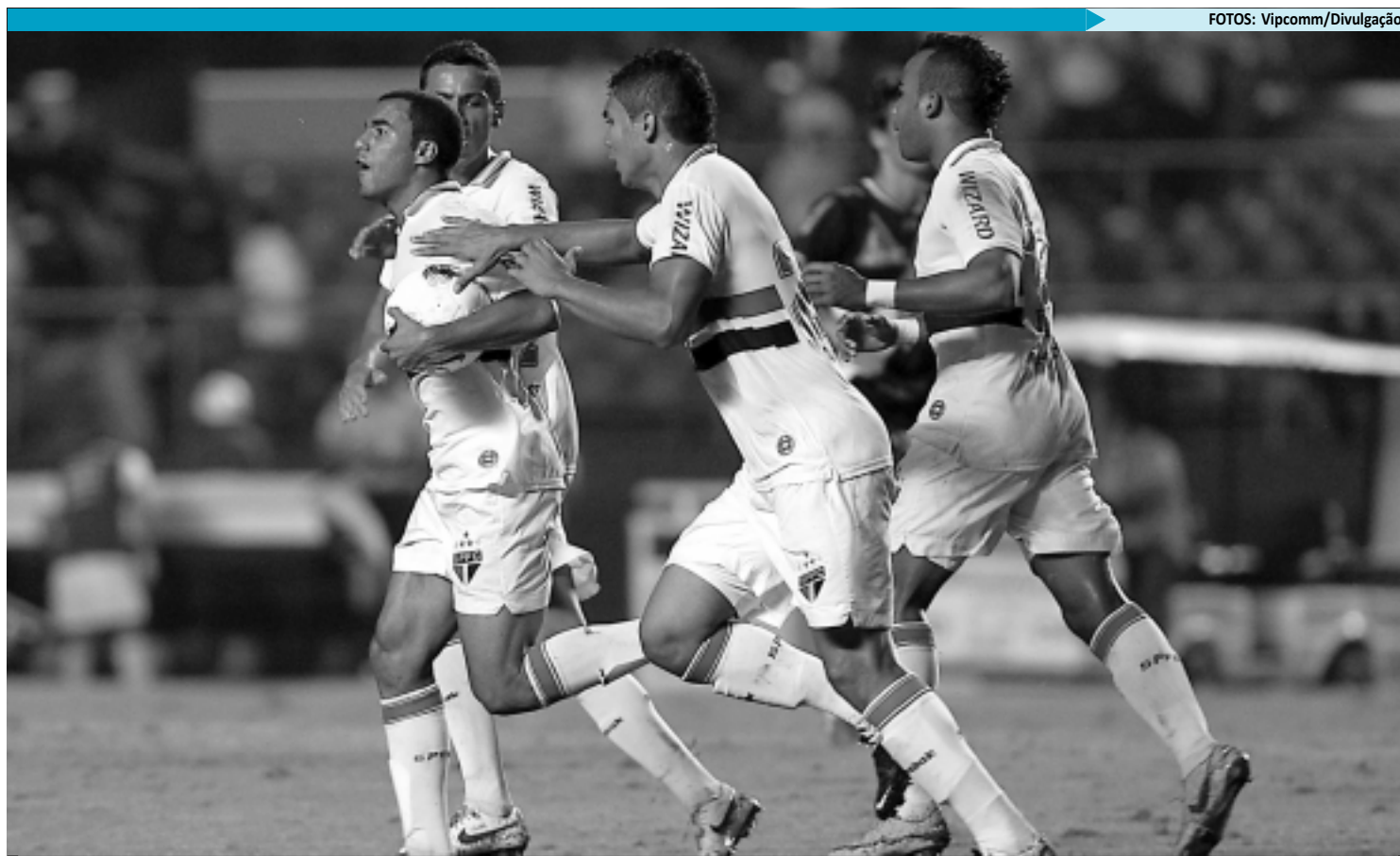
O São Paulo é o segundo clube da lista dos mais ricos com R$ 226 milhões, ganhos principalmente com o Morumbi e seus valorosos jogadores

Os gaúchos, porém, compensam a diferença com a renda proveniente dos sócios, que representam 21% de suas receitas. O Santos é o quarto da lista, graças aos ganhos com bilheteria (em que é o mais rentável do país) e patrocínio (ancorado pelo fenômeno Neymar). O Flamengo, que recebeu a segunda maior cota de TV (R$ 94,4 milhões), aparece em quinto lugar na lista.