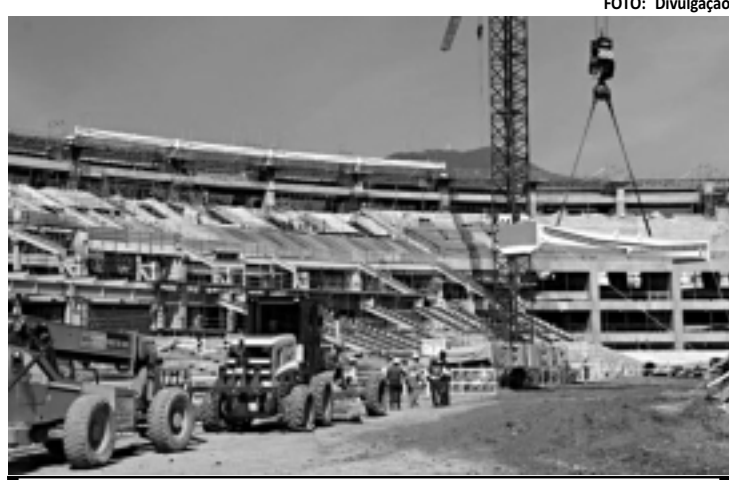
Maracanã está com 50% das obras feitas, mas ainda preocupa

Com 50% de conclusão, obra do Maracanã ainda preocupa. Na tabela com seis sedes, estádio receberia a Seleção Brasileira apenas em uma eventual final do torneio de 2013. A primeira tabela conta com as seguintes cidades indicadas à Fifa: Fortaleza, Brasília, Belo Horizonte e Rio de Janeiro, além de Recife e Salvador, que esperam por definição da entidade para serem confirmadas ou não na competição do ano que vem. Neste caso, o Brasil só jogaria no Maracanã se chegasse à final do torneio, assim como na Copa do Mundo. Na segunda possibilidade, a Fifa