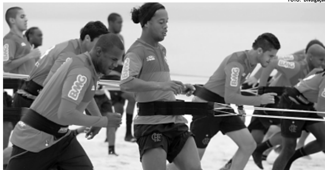
O Flamengo, de Ronaldinho (C), segue caindo de cotação entre os clubes mais ricos do futebol brasileiro

ENDIVIDAMENTO CRESCE 89% EM CINCO ANOS - Apesar dos bons indicativos apresentados pela análise, existem problemas para os clubes. E as dívidas são as grandes vilãs. Nos últimos cinco anos, os 20 clubes analisados passaram de um en-