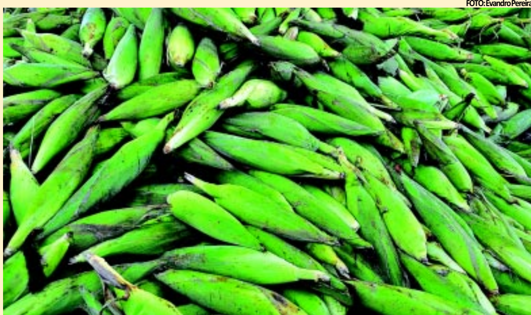
Devido a estiagem, o preço do milho deve ficar mais caro este ano e a oferta será menor no Estado