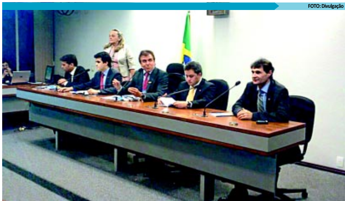
Parlamentares da Paraíba tiveram encontro com prefeitos que participam de marcha, em Brasília, ontem

O parlamentar lembrou que a presidente Dilma Rousseff esteve recentemente no Nordeste, em Sergipe, onde prometeu ajuda emergencial para o enfrentamento da estiagem. "O que queremos é que o Governo Federal saia um pouco da retórica. A presidente anunciou ajuda emergencial, mas essa ainda não chegou. Queremos o exército participando das ações. Como diz o ditado, 'quem tem sede tem pressa'", disse Rodrigues.