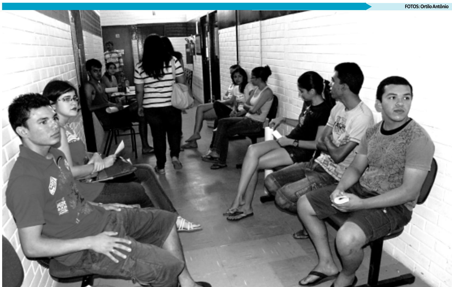
Alunos ocuparam os corredores da Reitoria da UFPB em protesto por uma possível retirada de nomes numa lista para a residência universitária

As boas ações do pró-reitor de assistência e promoção estudantil parecem ainda não terem agradado alguns estudantes que prometeram recorrer ao Ministério Público