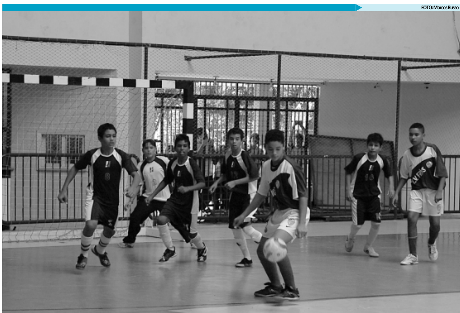
O futebol de salão é um dos esportes dos Jogos Escolares da Paraíba que terá a participação de escolas públicas e privadas da Grande João Pessoa

Os Jogos Escolares e Paraescolares da 1ª Região de Ensino contarão com a participação de escolas públicas e privadas das cidades de João Pessoa, Cabedelo, Bayeux, Santa Rita, Cruz do Espírito Santo, Conde e Alhandra.