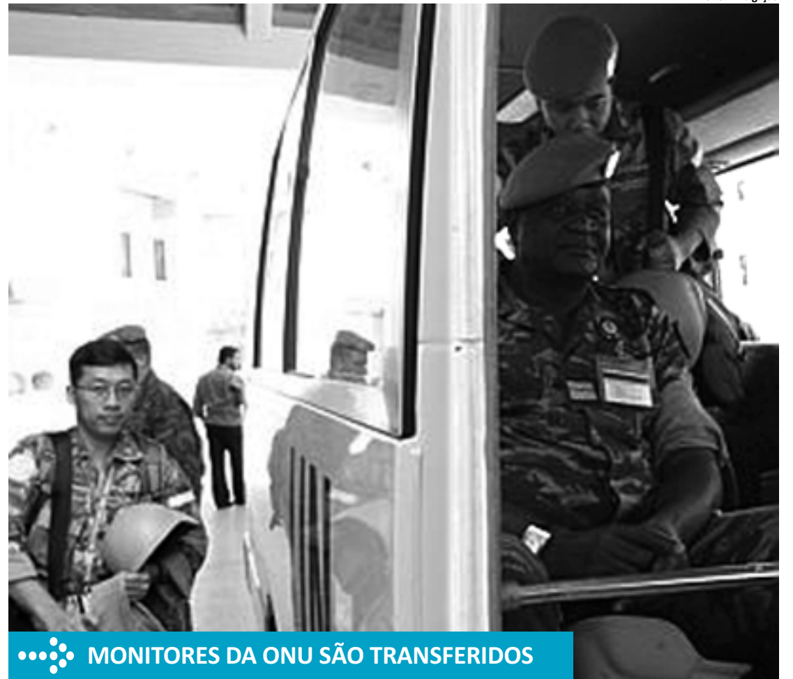
MONITORES DA ONU SÃO TRANSFERIDOS

Isto pode afetar especialmente a Cúpula da Otan nos dias 20 e 21 de maio, na qual se deve discutir a entrada da Macedônia na Aliança, algo que a Grécia veta por diferenças sobre o nome do país. "O fato de que haja um governo de transição aumenta a responsabilidade dos partidos políticos", advertiu o líder do partido social-democrata Pasok, Evangelos Venizelos.