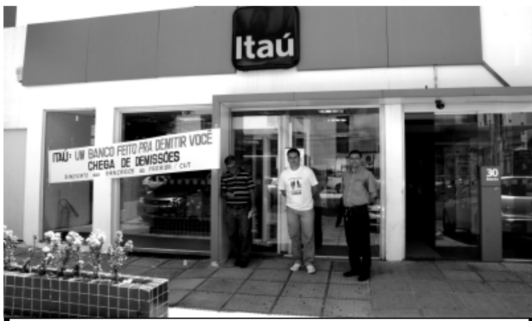
Por conta do protesto, o funcionamento das agências do banco ontem ficou prejudicado nas agências de JP

"O Banco Itaú vem dando um tratamento desumano aos bancários que estão sendo cobrados a cumprirem metas inatingíveis e está dispensando os funcionários, sem sequer lhes dar a oportunidade de se realocarem ou se inscreverem no Progra-