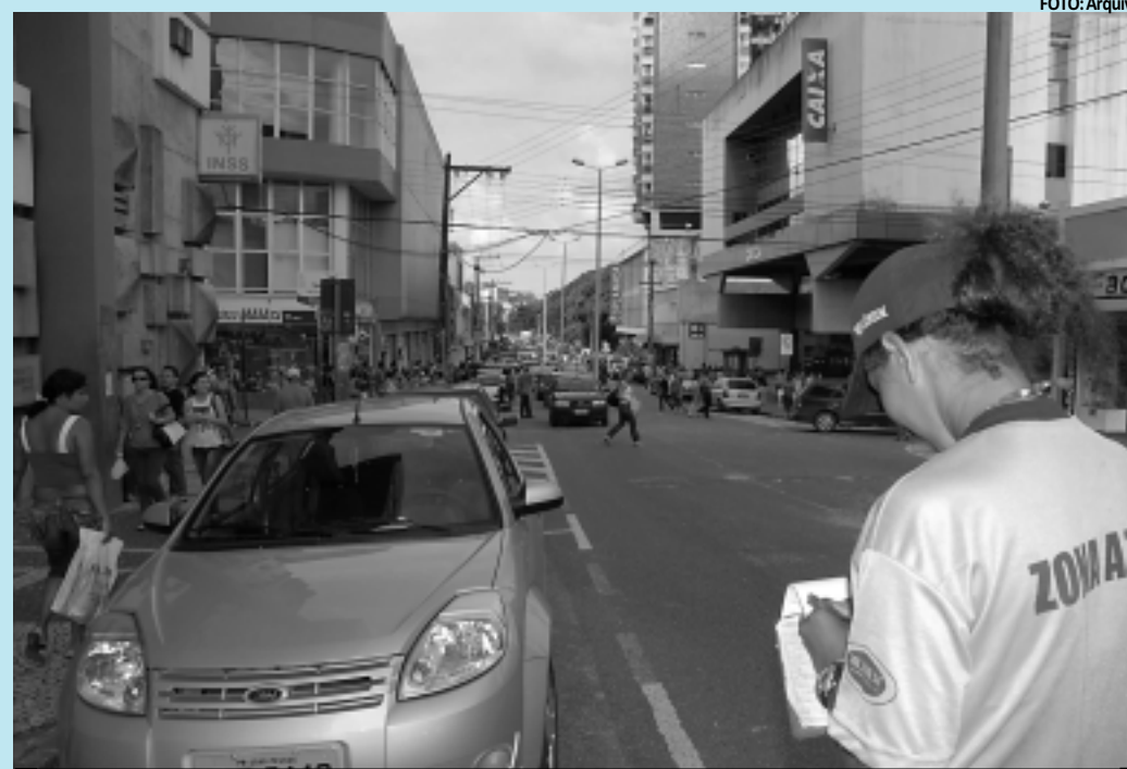
Semob garante que mudança na Zona Azul não vai interferir no valor da taxa cobrada atualmente