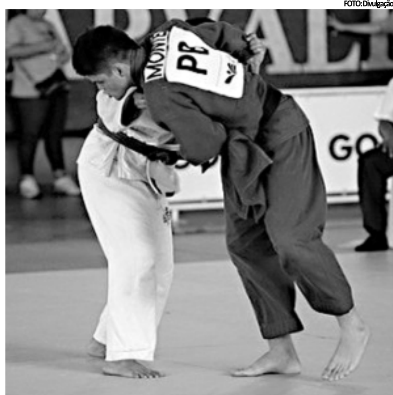
O paraibano (D) terminou em sétimo lugar na etapa disputada em Lyon