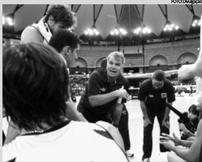
Bernardinho usará disputa para preparar Seleção para Olimpíadas