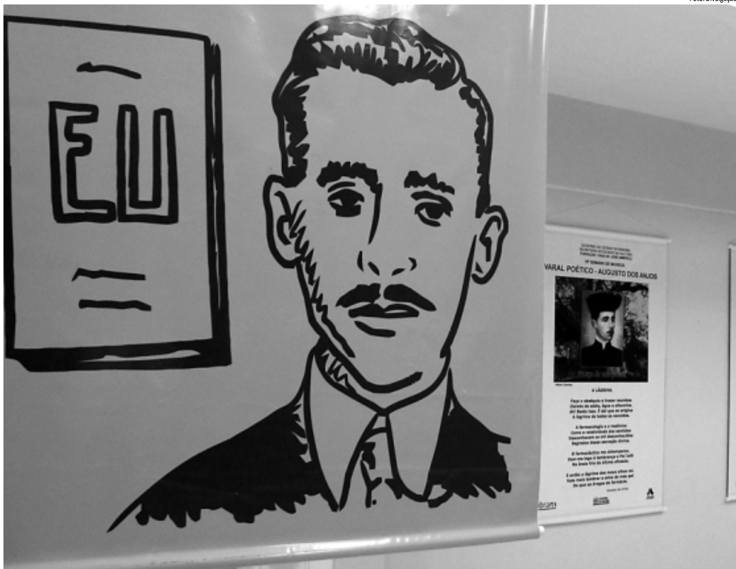
Além da homenagem aos cem anos de publicação do livro Eu , o evento também comemora as três décadas de atividades da Fundação Casa de José Américo