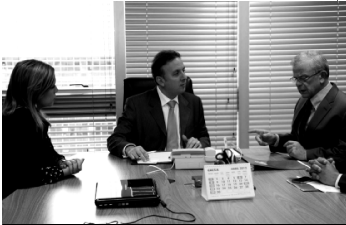
O prefeito Luciano Agra (D) discutiu projetos prioritários com o ministro Aguiinaldo Ribeiro, ontem à tarde

Segundo Doda de Tião, em sua justificativa, a proposta foi criada "visando a conscientização, a prevenção e erradicação da violência física ou psicológica - 'bullying' - no ambiente escolar". O dia foi escolhido por ser a data em que ocorreu o massacre na "Escola Municipal Tasso da Silveira", no bairro Realengo, no Rio de Janeiro.